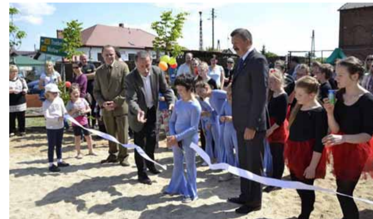
Fot. Oficjalne otwarcie placu zabaw w rytualnym przecięciu wstęgi.

Kultury, przedstawiciel Nadleśnictwa Oborniki Śląskie, przedstawiciel Urzędu Marszałkowskiego oraz przedstawiciele Szkoły Podstawowej w Urazie i Szkoły Podstawowej nr 2 w Obornikach Śląskich. Prezes Stowarzyszenia zaprezentowała trudny jakże zostały pokonane przy powstawaniu placu zabaw oraz podkreśliła ogromny udział mieszkańców w realizowanym projekcie. Po uroczystym przecięciu wstęgi, poświęceniu placu zabaw i symbolicznym sadzeniu słoneczników na wszystkich uczestników imprezy czekał wspaniały, imponujących rozmiarów tort.