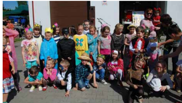
Fot. Dzieci brały udział w konkursie na najciekawsze przebranie.

Na placu imprezy nie brakowało licznych atrakcji. Uroczystość uświetniły występy dzieci i młodzieży z Reprezentacyjnego Dolnośląskiego Zespołu Pieśni i Tańca „WROCLAW” oraz zespołu ISKRA i ISKIERKA ze Szkoły Podstawowej w Urazie. Mimo pięknej pogody