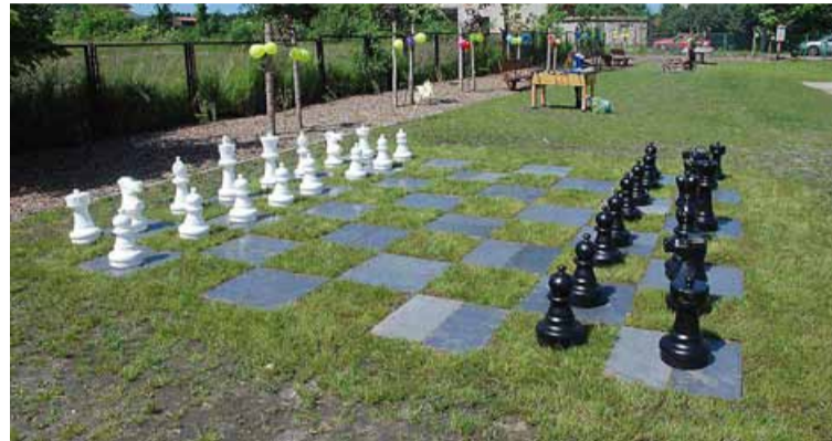
Fot. Szachy plenerowe – innowacyjny pomysł na terenie Gminy Oborniki Śląskie.

Na tak ważne dla mieszkańców wydarzenie przyjechało wielu zaproszonych gości, sympatyków miejscowości i osób wspierających realizację projektu, m. in. Burmistrz Obornik Śląskich wraz z małżonką, Dyrektor Obornickiego Ośrodka