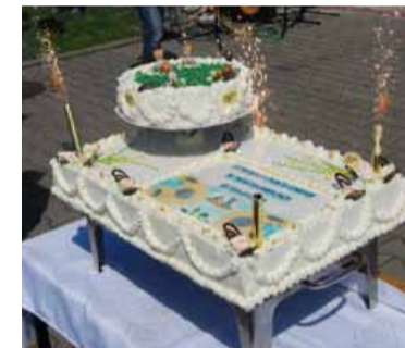
Fot. Tort dla wszystkich uczestników imprezy.

z Rościslawic przygotowała specjalny pokaz imitujący wypadek przy udziale rowerzystów. Uczestnicy imprezy mogli także skorzystać z darmowych warsztatów filcowania i odwiedzić stoisko z produktami regionalnymi słonecznikowej wsi. Jedną z największych atrakcji przygotowanej dla dzieci był kon-