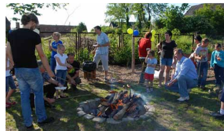
Fot. Ognisko integracyjne na terenie placu zabaw