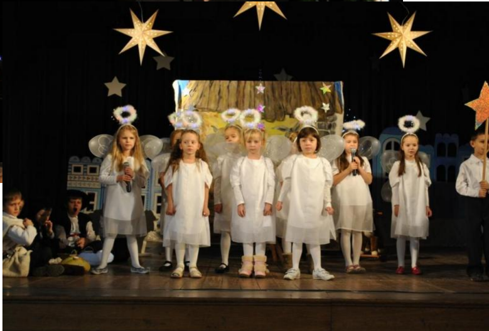
Fot. Mali artyści z Pęgowa

W szwach śniegi, rodzice, starsi i młodzież wszyscy z wielką niecierpliwością oczekują na Mikołaja. Od rana oczekiwanie umotywowują przepisy dzieci i młodzieży. Jako przykład możemy podać przepisy z Przedszkola „Słoneczko” w Obornikach Śląskich, występując w przepięknym