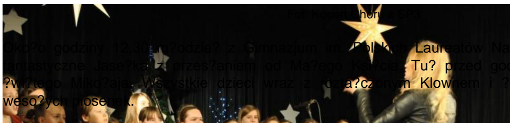
Fot. Załoga w Mikołaja podczas zabawy z dziećmi

Jednak nie tak nie ożywiło oczekujących jak pojawienie się samego Mikołaja, który po udanym przedostaniu się przez łomy odczarujących go dzieci dotarł do sceny aby wręczyć kałdemu dziecku paczkę ufundowaną przed Gminą Oborniki Śląskie. Ile radości dale taki podarek, dowie się tylko ten kto by wiedział razem z nami.