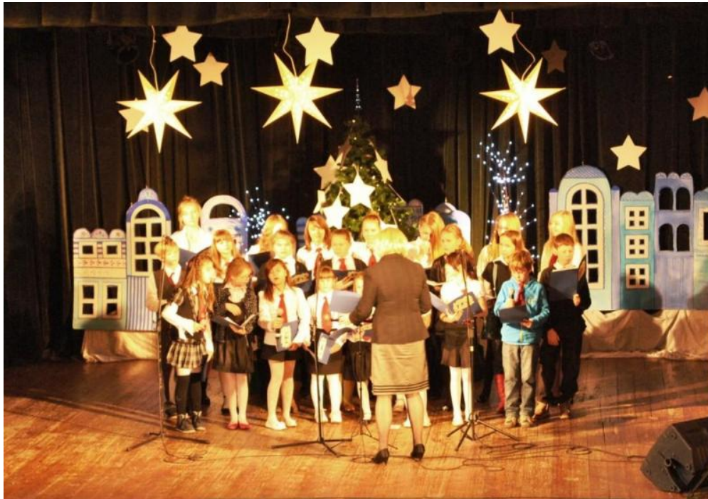
Fot. Koncert Chóru z SP w Osolinie