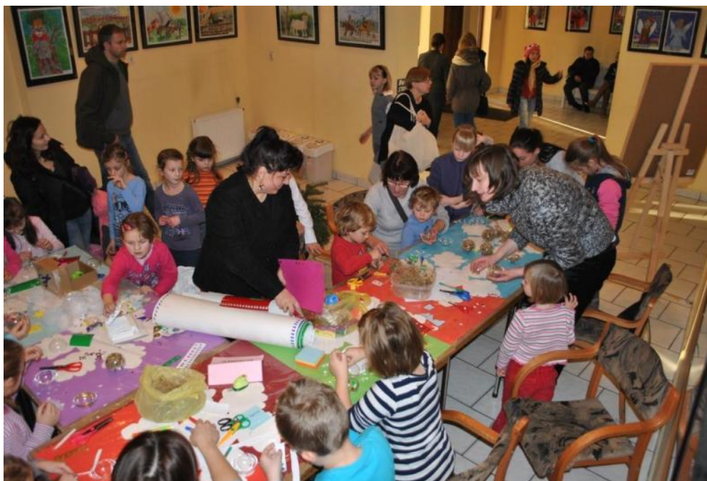
Fot. Warsztaty Dekorowania Bombek