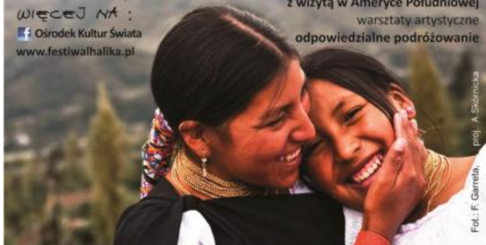
proj.: A. Skórnicka