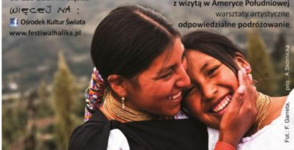
proj.: A. Skórnicka