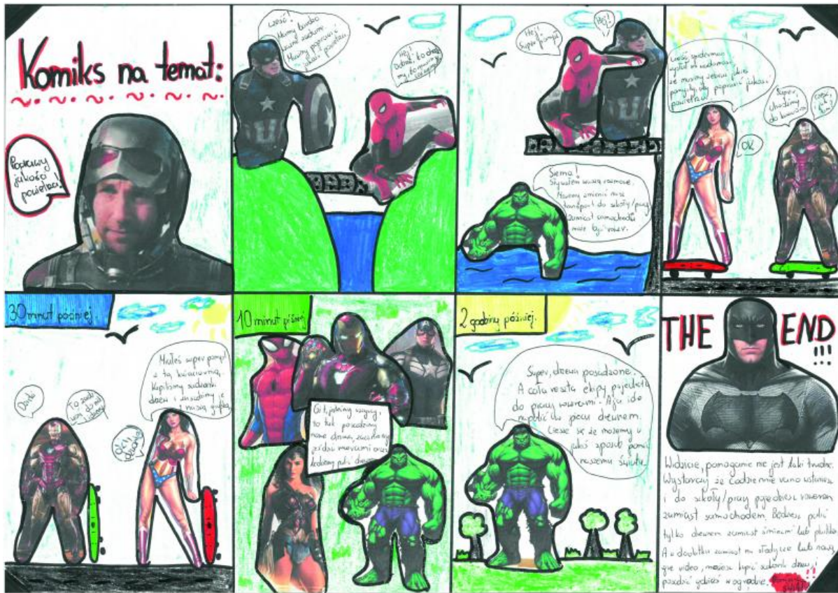
II miejsce kl 5-8