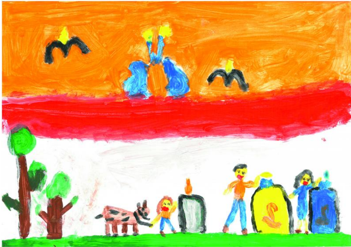
II miejsce kl 0-4