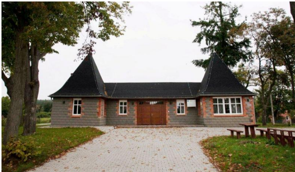
Remont wietlicy w Jarach na Centrum Ekologiczno – Informacyjne