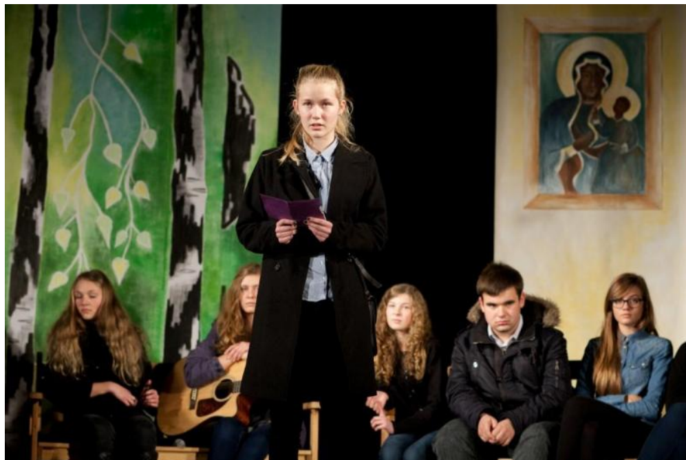
Gimnazjum Pęgów Przedstawienie