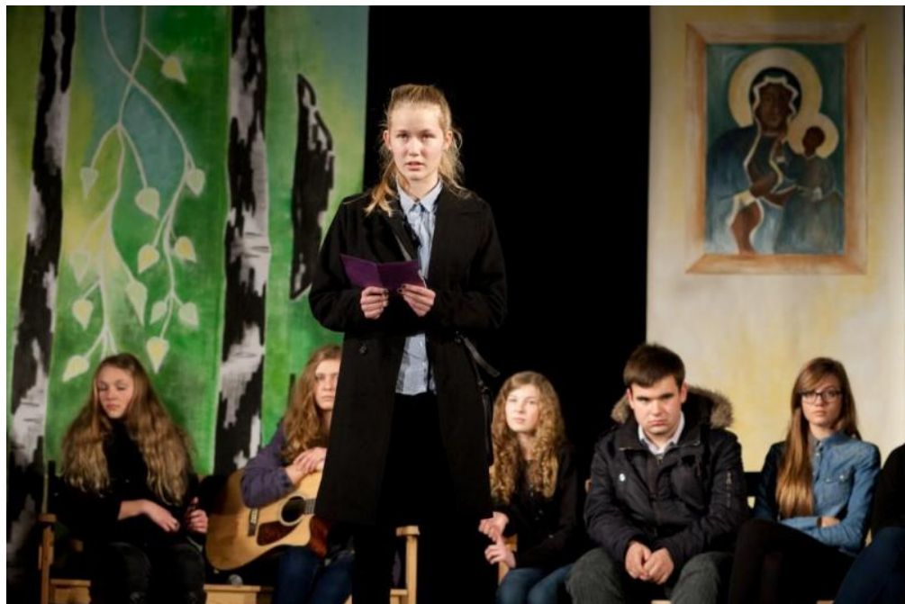
Gimnazjum Pęgów Przedstawienie