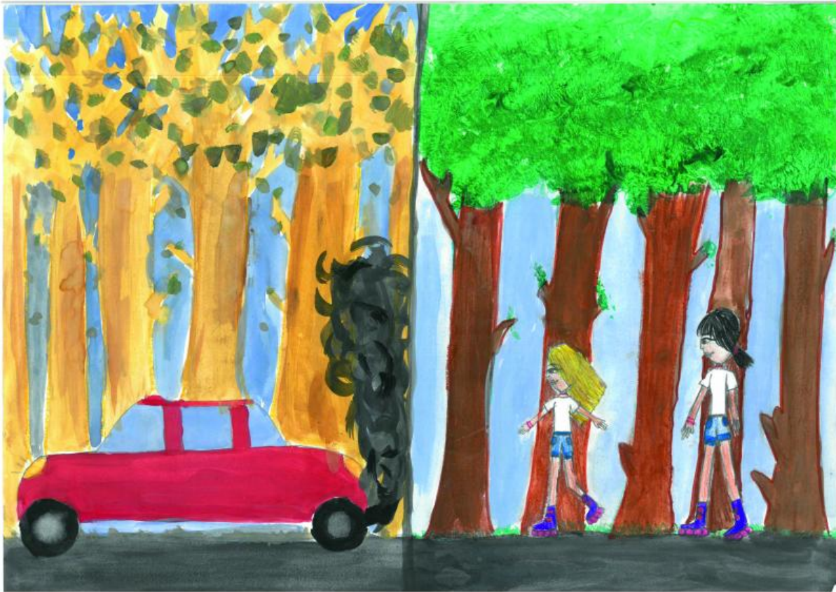
I miejsce plastyczny