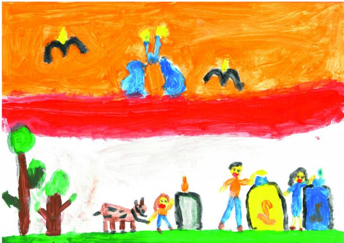
II miejsce kl 0-4